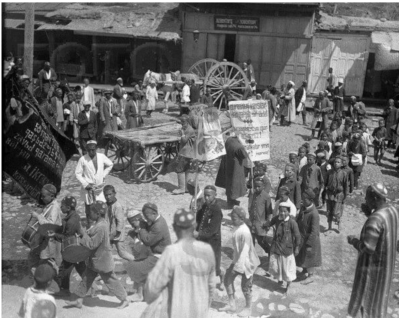
Пионеры идут по майдану с барабанами. Узбекистан, 1928 год.

«Человек вводит искусственные стимулы, сигнифицирует поведение и при помощи знаков создает, воздействуя извне, новые связи в мозгу»; «в высшей структуре функциональным определяющим целым или фокусом всего процесса является знак и способ его употребления».